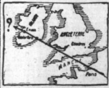
Le trajet connu de l'avion disparu, du Bourgot jusqu'en Irlande

Les recherches entreprises pour retrouver l'avion de Nungesser sont poussées très au large dans l'Atlantique, par les garde-côtes et les hydravions de Boston. Trois avions de Gloucester et vingt bateaux patrouillent tout des recherches dans un rayon de cent milles des côtes. Huit contre-torpilleurs par-