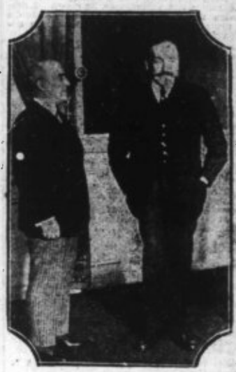
M. MORIN, enclen Préfet de Nord - à droite - quittant la Préfecture de Police, a remis ses pouvoirs à M. Chiappe, son successeur. On les voit ici tous deux dans le bureau préfectoral.