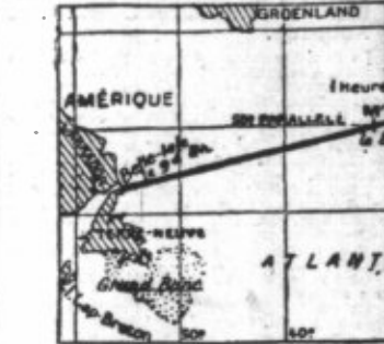
Le projet d'itinéraire qui avait été établi par les aviateurs, avec variantes sur l'Irlande, et indiquant les heures de leur passage éventuel aux principaux points de passage...