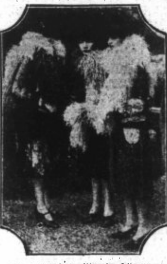
C'est pourquoi ces élégantes frioleuses se précipitent de la bise à l'aide d'énormes ailes de plumas...