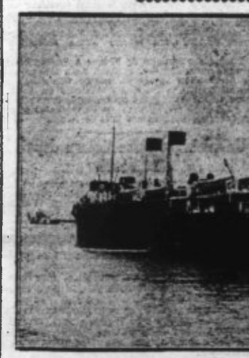
Un des trois paquebots qui assureront le service de la nouvelle ligne Dunkerque-Tilbury

C'est aujourd'hui jeudi que commencera le voyage d'inauguration de la ligne maritime Dunkerque-Tilbury