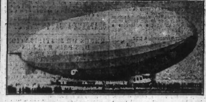
Le dirigeable américain à Los Angeles a qui, effectué des recherches dans une zone étendue

Ainsi que nous l'avons montré hier, il semble se confirmer, à la suite de multiples témoignages recueillis, que le roulement d'un moteur d'avion a été entendu lundi à Terre-Neuve. On sait d'autre part que tous les avions de la marine américaine ayant circulé à certaine distance de celle de la mer.