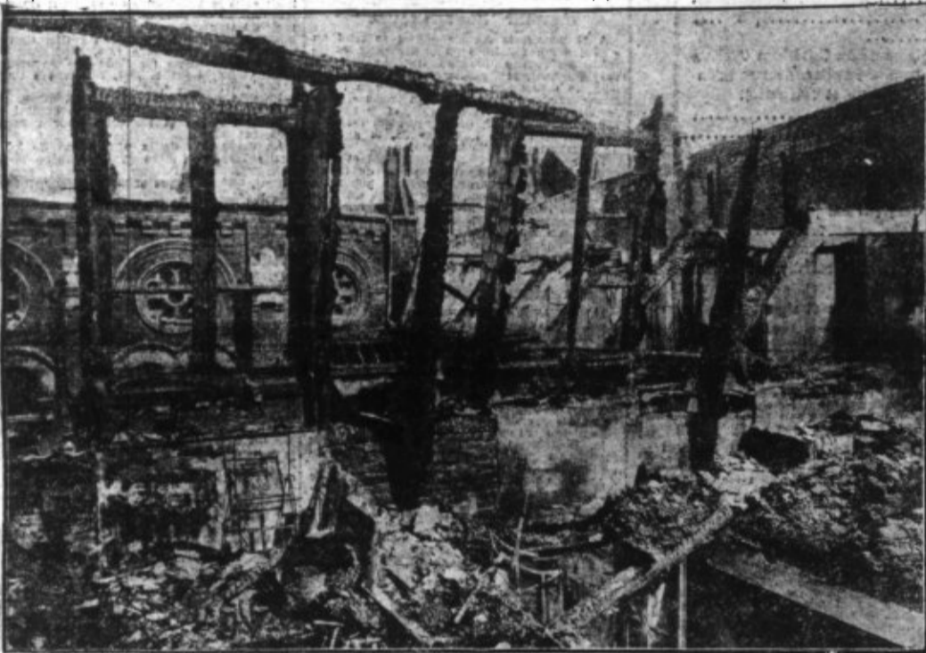
UNE VUE GÉNÉRALE DE LA PARTIE SUPÉRIEURE D'UN DES BATIMENTS DÉTRUITS