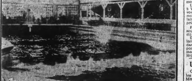
C'est celui-ci qui vient d'être inaugurée au Luna Park de Berlin. Elle mesure 33 mètres de longueur. Une installation spéciale, produit des vagues artificielles, qui donnent au nageur l'impression de nager en mer.