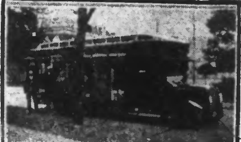
C'est cette voiture automobile pourvue d'étaiages, propriété d'une grande maison de confiserie de Wismar, que va de village en village, et évite à la clientèle les onéreux déplacements.