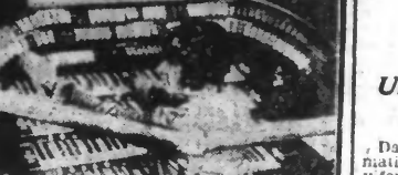
C'est celui du Mecca-Tempel à New-York, qui compte 200 registres et quatre claviers.