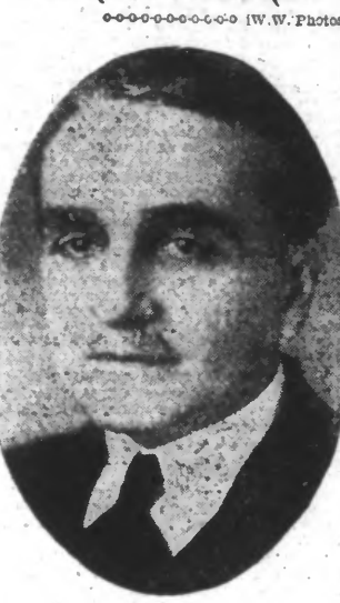
M. PAUL FAURE

Il y a quinze jours, au cours d'un débat très vif devant la C. A. P. du Parti Socialiste, à l'occasion de la loi sur la réorganisation de la nation pour le temps de guerre, de M. Paul Faure, secrétaire général du Parti Socialiste, avait donné sa démission.