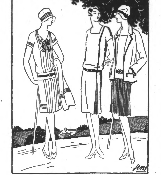
MODELE N° 108. - Robe de sport en tulle, drap, tulle ou tulle de couleur.