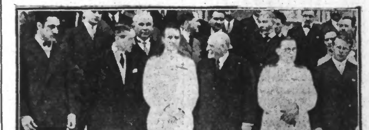
BYRD ET SES COMPAGNONS DE VOYAGE AU COURS D'UNE RÉCEPTION

A Calais, Dunkerque, Etaples et Paris-Plage ils ont été l'objet de réceptions triomphales