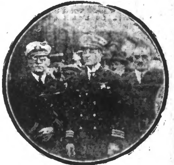
Noville et Byrd au cours de leur réception à Calais Maritime

Dimanche fut jour de repos pour les aviateurs américains Byrd, Noville, Acosta et Balchen. Les réceptions de la veille avaient été quelque peu fatigantes et, de plus, Byrd et Acosta étaient un peu souffrants.