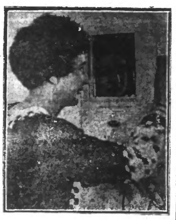
C'est le chauffe-fer automatique qui pour 20 centimes, permet aux élégantes de maintenir leurs boucles, sur le pil.