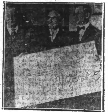
C'est celle-ci qui a été adressée par un congrès de postiers au Directeur général des Postes des Etats-Unis. Elle mesure 0 m.90 sur 0 m.70. L'envoi a coûté 1 dollar.