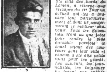
Antonin MAGNE qui se distingue particulièrement au cours de l'étape Briançon-Evian.

pathique réception qu'ils eurent à Evian lors de leur retour en terre française, au cours de l'après-midi du 10 juillet.