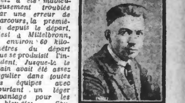
Nicolas FRANTZ vainqueur de la 21 e étape

La 21 e étape du Tour : Strasbourg-Metz a été malheureusement troublée par une erreur de parcours, la première depuis le départ. C'est à Mülheim, à environ 60 kilomètres du départ que se produisit l'incident. Le train avait été assez régulier dans toutes les équipes avec pourtant un léger écart pour les « bleu-bleu ». Soudain le team des « pyrénéens » qui avait pris le premier le départ, s'engagea dans une mauvaise route sur des indications erronées.