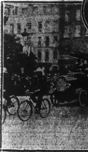
EN HAUT : Le général Lacapelle passant en revue les anciens combattants. — AU MILIEU, en médiation : Les autorités civiles assistant à la revue militaire. — EN BAS : Le défilé des Sapeurs-Pompiers de Lille et de leur matériel automobile.

Contrarié par le mauvais temps, le 14 juillet est néanmoins resté un jour de fête à Lille. Les édifices publics étaient pavés, nombre de maisons, particulières avaient, elles aussi, observé cette tradition.