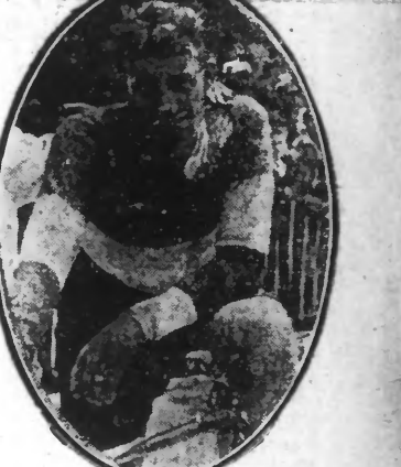
LEDUCQ, l'espér français

La 21 e étape du Tour : Strasbourg-Metz a été malheureusement troublée par une erreur de parcours, la première depuis le départ. C'est à Mülheim, à environ 60 kilomètres du départ que se produisit l'incident. Le train avait été assez régulier dans toutes les équipes avec pourtant un léger écart pour les « bleu-bleu ». Soudain le team des « pyrénéens » qui avait pris le premier le départ, s'engagea dans une mauvaise route sur des indications erronées.