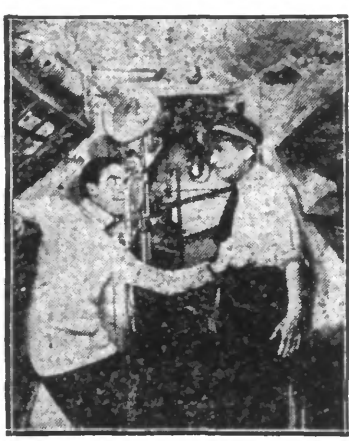
Le fast stopper immédiatement ou sauter

Drame de la mer. Pathé-Consortium-Cinéma. L'officier de marine Maurice de Vergne, marié à Anna Guirec et père d'un jeune fils, rencontre Mousissia Féodorovna qui a été le fiancé de celui-ci, par un hasard.