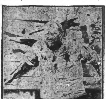
Une scène dramatique de « Vaincre ou mourir »

de Laurence Stallings, George Wallace et Charles Car et Walter Wood. (Film PARAMOUNT)