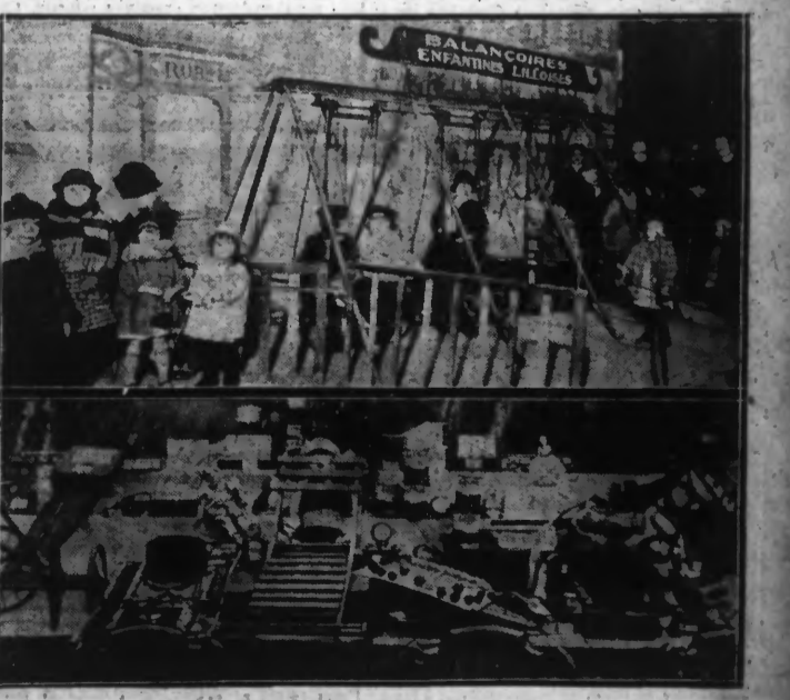
Les fêtes du Palais Rameau à Lille - EN HAUT : Les balançoires. - EN BAS : Les lots du concours Radio P.T.T. Nord à Lille.

Ne vous étonnez donc point, si vous ne trouvez pas en ces colonnes, les noms d'ra dévoués que nous avons cru reconnaître au cours de cette tournée. En réalité, c'est « Bonhomme Noël » qui passe, et il désire qu'on ne nomme personne d'autre, car les autres sont des ombres fugitives qui à la vertu de « charité » joignent celle de « modestie ».