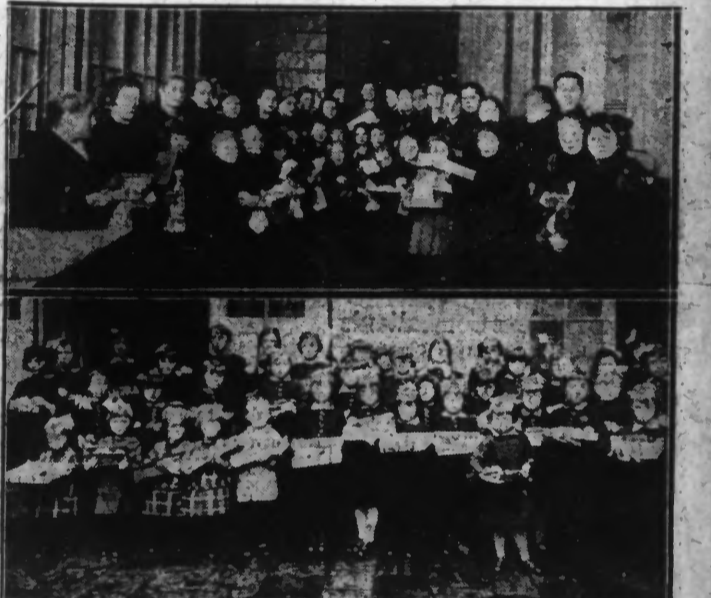
EN HAUT : Un groupe de petites orphelines, qui s'étaient la visite, hier, du Comité de l'Arbre de Noël à Lille. EN BAS : Un groupe de petites orphelines, qui s'étaient la visite, hier, du Comité de l'Arbre de Noël à Lille.

La randonnée charitable. Elle débute par la maison du « Bon Pasteur ». On suit qu'on est assis, quatre cents enfants sont à nouveau éduqués. Pour elle, « Bonhomme Noël », déposé, rue de la Préfecture, des joujoux, des coquilles, des friandises.