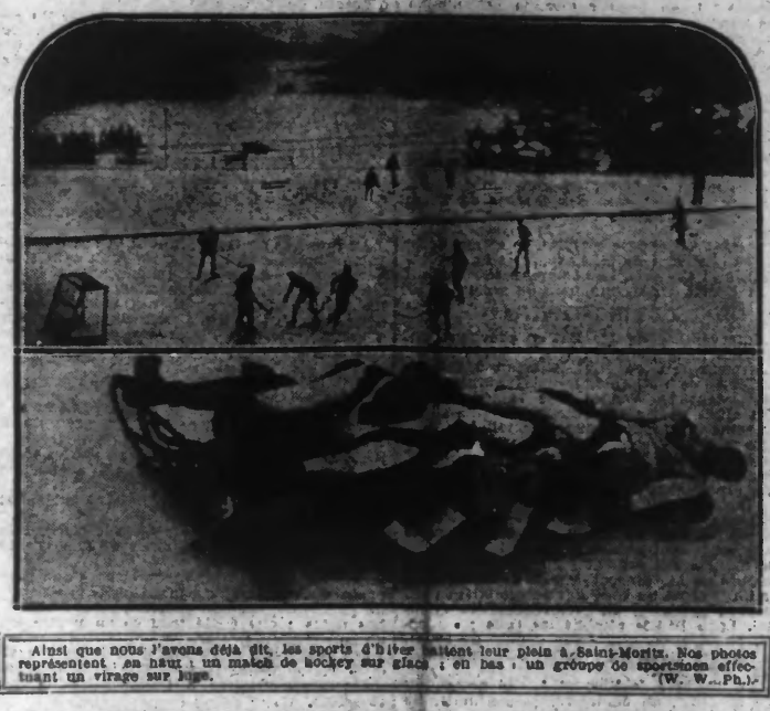
Ainsi que nous l'avons déjà dit, les sports d'hiver attirent leur plein à Saint-Moritz. Nos photos représentent: au haut, un match de hockey sur glace; en bas, un groupe de sportsmen effectuant un virage sur neige.