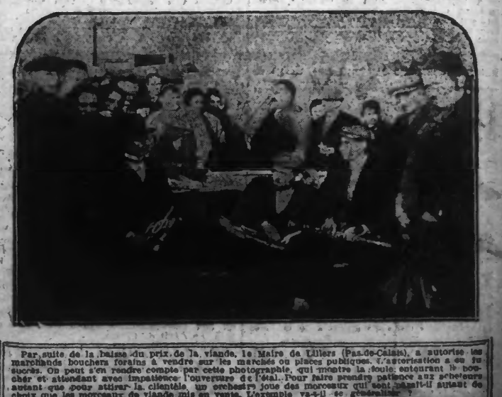
Par suite de la baisse du prix de la viande, le Maire de Lillers (Pas-de-Calais), a autorisé ses marchands bouchers français à vendre sur les marchés ou places publiques, l'association à sa fois. On peut s'en rendre compte par cette photographie, qui montre la foule entourant le boucher et attendant avec impatience l'ouverture de la boucherie. Pour faire attendre patiemment aux acheteurs avant que soit attiré le client, un orchestre joue des morceaux qui sont, sans nul doute, le choix que les morceaux de viande mis en vente. L'exemple va-t-il se généraliser?