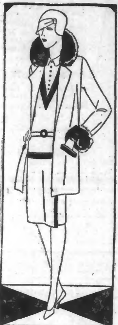
MODELE No 209. - Paletot trois-quarts garni de fourrure.