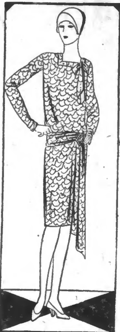
MODELE No 208. - Joli petit noir en tissu imprimé.