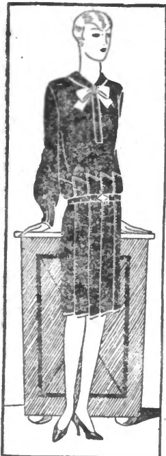
MODELE No 206. - Gracieuse robe de popeline ou de kasha.