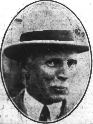
M. Pierre FARMAN qui le premier, il y a 20 ans, le 14 février 1906, bondissait en sautant un circuit fermé de 200 kilomètres, sur le plan d'aviation, il fut le Moulinex qui se mit à voler dans les nuages.