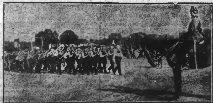
Pour éduquer les chevaux de la police montée belgo-belge, des manifestations bruyantes sont organisées sur les champs de manèges, au cours desquelles, ce ne sont pas les batteries de gros canons, ni éclatements de bombes, mais les coups de fouet, les coups de cravache, qui font retentir les foules.