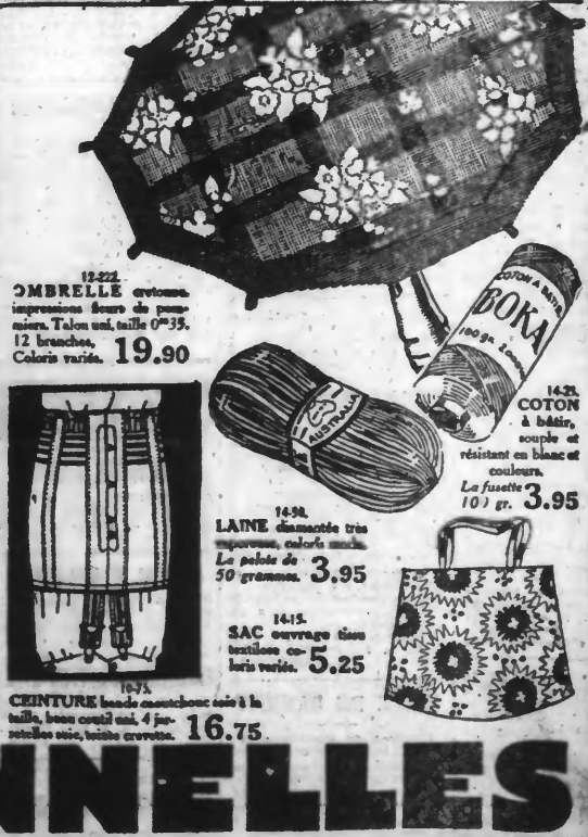
35-202. CASAQUE toile de Lyon, manches longues, jabot orné nervures et jours en blanc et gris. 66 fr. 35-204. CASAQUIN voile de coton, manches longues, jabot plissé (so fait en blanc seulement). 29 fr. 35-206. CASAQUIN crêpe de Chine, forme chemisier, plus ornés jours. Blanc, rose, gris, sable, marine et noir. 98 fr. 41-212. MANTEAU laine tricotée, garni boutons, ceinture boucle, beige, mode. Le 60.89 fr. 31 fr. sur par taille lise 90 12-221. OMBRELLE crêtonne, impressions fleurs de pommiers. Talon uni, taille 0°35. 12 branches. Coloris variés. 19.90 14-52. COTON à bâtir, soie et résistant en blanc et couleurs. La fassette 101 gr. 3.95 14-53. LAINE diamantée très impression, coloris mode. Le pelote de 50 grammes. 3.95 14-15. SAC couverture tissu toile co-5 lins variés. 5.25 16-75. CEINTURE bande nouée avec à la taille, bon-coll uni, 4 jolis dessins soie, toile crêtonne. 16.75