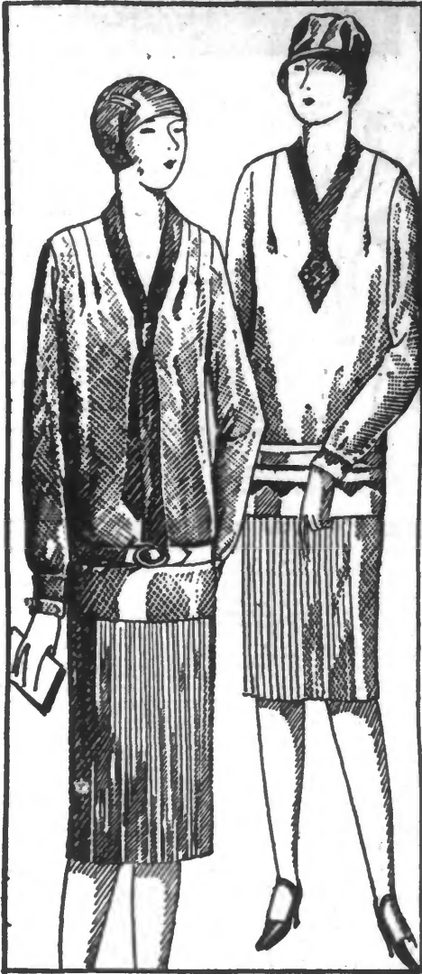
47-817. ROBE en fine popeline, manches longues, col et cravate en crêpe de Chine, ceinture avec bouton galalith, devant de la jupe plissé pisté. De 38 au 50 inclus. Coloris mode. 98 fr. 47-814. ROBE deux pièces en cashinette, manches longues, garnie applications en tulle uni. Encolure terminée par motif serré points de broderie soie et tulle. Jupe devant plissé. Existe en tons : naturel, vieux rose, vert, bleu et gris clair. Toutes tailles. 98 fr.