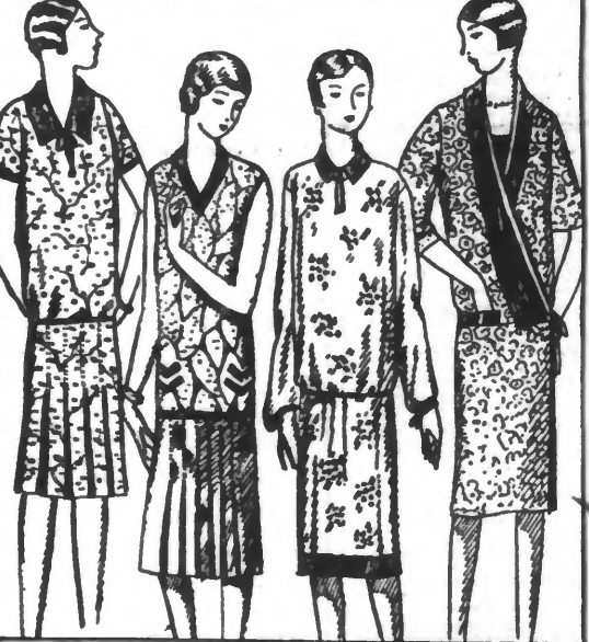
48-42. ROBE de jupe "Les". 48-43. ROBE marine, for- 48-45. ROBE voile impressions 48-47. "EIGNON" forme kimono. Pommes croisées im- 48-48. "Les cerises", manches no simalme, imprès- cretoise imprimée, col et bande 48-49. "Les cerises", manches no simalme, imprès- cretoise imprimée, col et bande 48-50. "Les cerises", manches no simalme, imprès- cretoise imprimée, col et bande 48-51. "Les cerises", manches no simalme, imprès- cretoise imprimée, col et bande 48-52. "Les cerises", manches no simalme, imprès- cretoise imprimée, col et bande 48-53. "Les cerises", manches no simalme, imprès- cretoise imprimée, col et bande 48-54. "Les cerises", manches no simalme, imprès- cretoise imprimée, col et bande 48-55. "Les cerises", manches no simalme, imprès- cretoise imprimée, col et bande 48-56. "Les cerises", manches no simalme, imprès- cretoise imprimée, col et bande 48-57. "Les cerises", manches no simalme, imprès- cretoise imprimée, col et bande 48-58. "Les cerises", manches no simalme, imprès- cretoise imprimée, col et bande 48-59. "Les cerises", manches no simalme, imprès- cretoise imprimée, col et bande 48-60. "Les cerises", manches no simalme, imprès- cretoise imprimée, col et bande

SOIERIES TAFETAS GLACÉ belle qualité pour robes, joli choix de coloris mode. Largeur 0m.90. 25.90 ZENACRÈPE, joli tissu nouveauté pour casaque et robes doublure. Largeur 0m.50. 16.50 CRÈPE SATIN lourd, pour toiles habillées, coloris classiques et mode. Largeur 1 m. 29.90 CRÈPE DE CHINE tout soie naturelle, belle qualité pour robes et blouses, toutes nuances. Larg. 1 m. 14.90 TOILE DE LYON mi-soie, lavable, pour lingerie et bonnes doublures. Largeur 0m.80. 6.90 TISSUS Très beau JERSEY laine et soie chiné en uni et rayures assorties pour ensembles, tous les coloris. Largeur 1m.40. 25.90 DRAPIERIE FANTAISIE pour tailleur mode, tout un assortiment de dessins nouveaux. Largeur 1 m.40. 19.90 CASHINA pour manteaux nouveaux de demi-saison, nuances mode. Largeur 1 m.40. 25.50 LAINAGES CRÈPE ÉTINCELANT, mi-soie, tissu riche pour jolies toilettes d'été, toutes nuances. Largeur 0m.80. 8.90 CRETONNE IMPRIMÉE très grand choix de dessins riches, pour robes de jardin. Largeur 0m.80. 4.25 CRÈPE NACRE impression mode, pour robes d'été, dessins nouveaux. Largeur 0m.80. 9.50