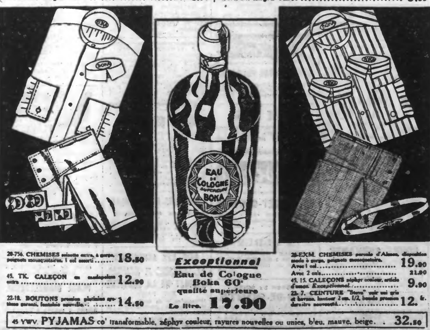
20-716. CHEMISES blanche extra, à revers, poignets noués, boutons. 1 set assorti. 18.50 45. TK. CALEÇON en mailles 12.90 22-18. BOUTONS pression plastique assortis garnis, fantaisie nouvelle. 14.50 Exceptionnel Eau de Cologne Boka 60° qualité supérieure Le litre. 17.90 25-EXM. CHEMISES parole d'Alain, dispositions mode à garni, poignets noués. Avec 1 set. 19.90 Avec 2 sets. 21.90 45. 15. CALEÇONS aléphy coloris, article d'usage. Exceptionnel. 9.90 22-7. CEINTURE "Boka" soie uni gris et havane, hauteur 2 cm. 1/2, bande pression dessinée nouveauté. 12. fr. 45 YVY. PYJAMAS co transformable, zéphyr coloris, rayures nouvelles ou unies, bleu, mauve, beige. 32.50