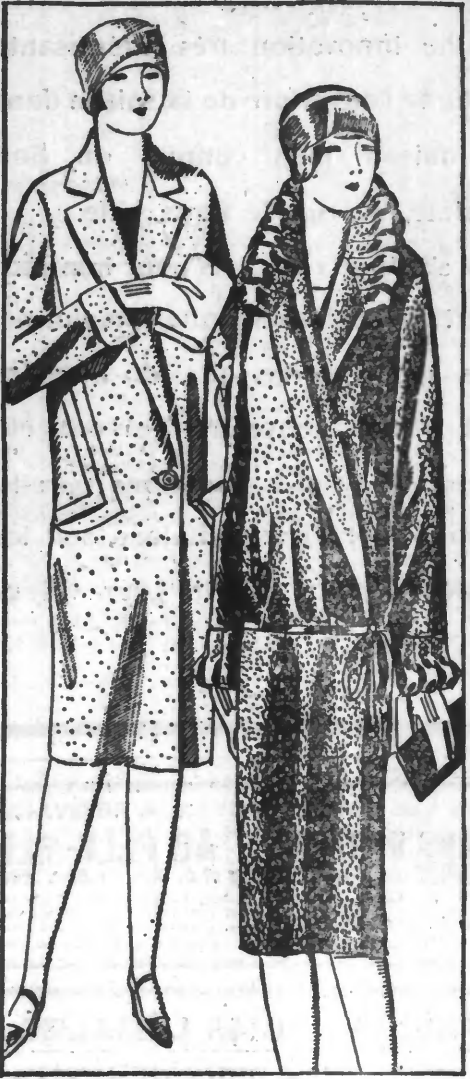
4-929. MANTEAU en cashinette, garni nervures et poches, façon soignée. Coloris clair. 129 fr. 4-925. MANTEAU soie brochée, belle qualité, dispositions nouvelles, entièrement doublé artificiel à ramages. Noir et marine. 129 fr.