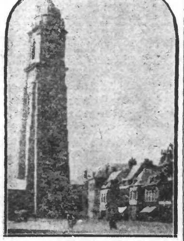
LE BEFFROI DE CAMBRAI

De fait, la tour Saint-Martin est de temps immémorial, dépositaire de la cloche commu-