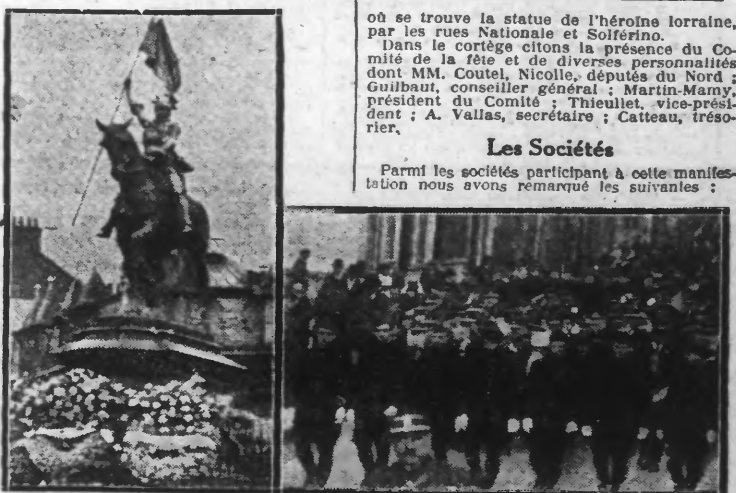
LA MANIFESTATION A LILLE. — A gauche : la statue fleurie de l'héroïne ; à droite : le cortège se rendant au Monument

A Lille, un cortège groupant 10.000 personnes se déroula paisiblement