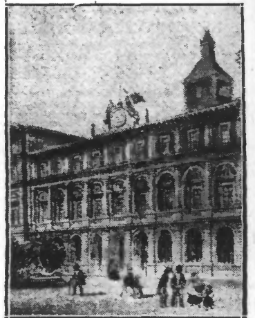
L'Hôtel de Ville de Lille et le Beffro en 1850 cheull' fos les Lillos l' trouvoit'n' admirable, ch'est à cause d' cha qu' Desrousseaux écrivot :

A l'époque, ch'étoit Loucheur qui l'étoit l' doyen des guetteux, ch'étoit de là qui annonçot l' incendies au son de l' cloque. Un vieux Saint-Sauveur qui m' docum'entot su l' Beffro, m' dijot l' auteur jour in m' faisant un clin d'oeil : « Avi L., d' tout in haut on y voyot l' Mont des Cats et l'Église Notre-Dame d' Tournai, mais ch' qu'on y voyot d' mieux, ch'étoit les déclarations d'amour qui s' faisoient là in haut ; cha s' comprind, énon, ch'étoit si près du ciel. In 1851, à l'exposition des Beaux-Arts, qui avot lieu au Palais Rameau, un dessin à l' plume, d'Ed. Boldoduc r'présintot l' Beffro d' Lille, et vettiez comm' ch'est drôle.