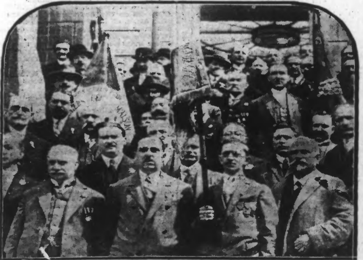
Les membres du Conseil d'Administration des Anciens Brigadiers et Caporaux avec les drapeaux des délégations.

(Lire le compte rendu en 2 e page, ainsi que celui de la fête du 75 e anniversaire de la Société Mutualiste « La Saint-Jean-Baptiste » d'Haubourdin)