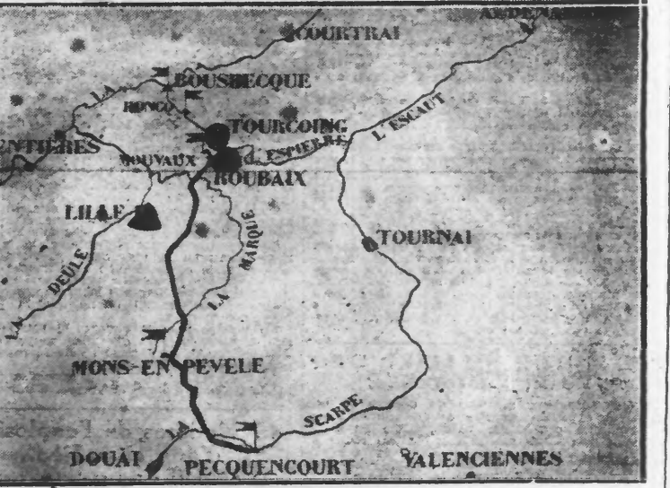
PLAN GEOGRAPHIQUE DE LA DISTRIBUTION DES EAUX DE ROUBAIX ET TOURCOING des Arts et Métiers, ingénieur des Arts et Manufactures, directeur du Service Municipal des Eaux de Roubaix-Tourcoing, s'exprime ainsi :

La présence des microbes associée à celle des matières organiques et des produits, intermédiaires de leur désintégration, sont de l'indice la plus manifeste de la souillure de l'eau, de sa contamination.