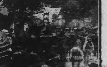
L'équipe Alcyon traversant un village

L'infaillible Opperman paraît avoir des ressources illimitées et il est bien capable, lorsque les autres passeront, de pousser un