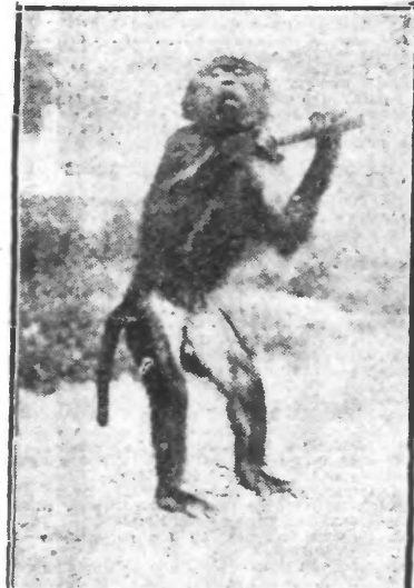
C'est d'un singe cynocéphale (Papiou) comme celui que l'on voit ici, dont on se servit pour l'opération.

UNE double opération de greffe humaine, selon le procédé du docteur Serge Voronoff a été faite jeudi dernier dans une importante clinique de Lille par trois éminents professeurs de la Faculté de Médecine.