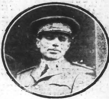
LE GÉNÉRAL NOBILE

Stockholm. — Le ministre de la Défense annonce que le général Nobile est sauvé. Le travail de sauvetage continue.