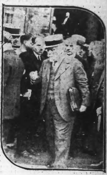
UN DOCUMENT HISTORIQUE! M. Poincaré sortant de l'Élysée après le Conseil des Ministres auquel il présenta son projet de stabilisation avant de le soumettre au Parlement.

en disant que ses collègues et lui voteront le projet parce qu'il consacre un état de fait.