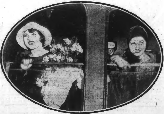
Ce sont « Miss France » et « Miss Paris » de 1929 que l'on voit ici à leur départ de la gare Saint-Lazare à Paris et qui s'en vont en Amérique disputer le tournoi annuel international de la beauté féminine.