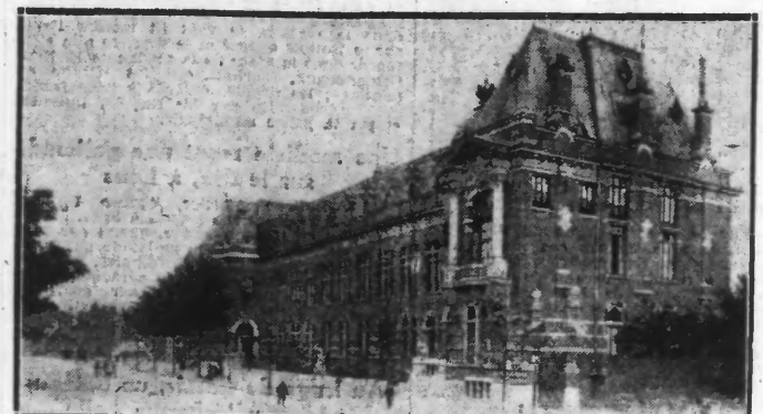
L'INSTITUT PASTEUR DE LILLE

Depuis quelque temps, dans le Pas-de-Calais, nous remarquons fréquemment que des quêtes, des ventes d'insignes, étaient faites, au profit de l'Institut Pasteur, de Lille. On a déjà répété souvent combien grande était la misère des laboratoires. Mais qu'on en ait réduit là, nous semblait extraordinaire. Nous avons voulu savoir quelle était exactement la situation financière du grand institut de notre région.