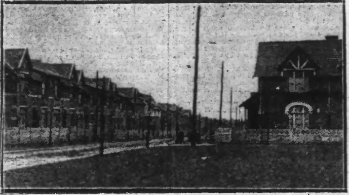
UN QUARTIER NOUVEAU D'AVION : LA CITÉ DU 7

Quel chemin parcouru maintenant ! Avion, petit village autrefois, vit sa prospérité commencer avec les installations mi-