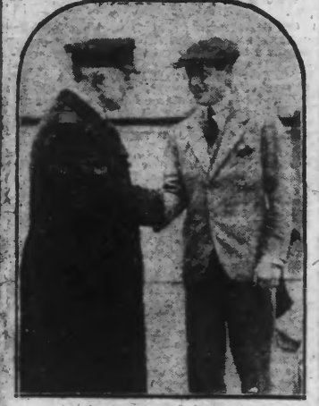
Le Prince de Galles à bord du navire qui vient de le ramener en Europe.

On ajoute à ce communiqué les renseignements suivants : Bien que les médecins déclarent qu'aucune nouvelle diminution des forces du Roi