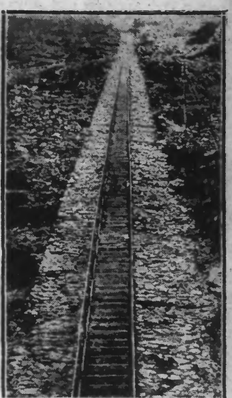
Cet escalier relie sans palier la côte à la ville de Jamestown, capitale de l'île Saint-Hélène où fut exilé l'empereur Napoléon I er .