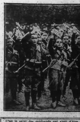
C'est le salut des poignards qui vient d'être adopté par les "Chemises noires" en Italie.