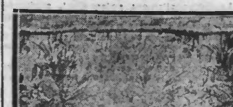
Cet enfant de 2 ans, né à la minute précise de la mort du Grand Lama, est considéré en Mongolie comme un Dieu. Il est profondément adoré par la foule des croyants.