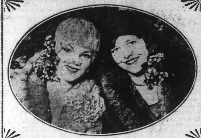
Il paraît qu'en ce jour de Noël, toutes les jeunes filles désireuses de se marier et de se faire aimer retourneront certainement vers leur chapeau une branche de cet arbre-bonheur. Comme il paraît qu'en ce jour de Noël, toutes les jeunes filles désireuses de se marier et de se faire aimer retourneront certainement vers leur chapeau une branche de cet arbre-bonheur.