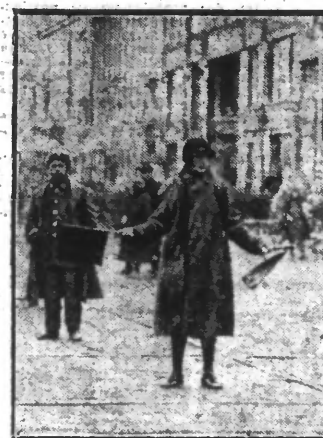
A Leningrad la police de la circulation est assurée par des femmes. On voit ici une « agent » dans l'exercice de ses fonctions.