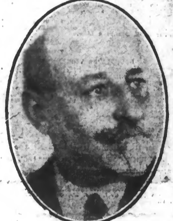
M. Fernand BOUISSON qui a été réélu Président de la Chambre sans concurrent.

Dans quelques jours, après un grand débat politique, nous verrons se constituer, pour la première fois, une majorité qui pourra prendre tous les républicains résolus à poursuivre le progrès social dans le cadre des institutions parlementaires, conformément