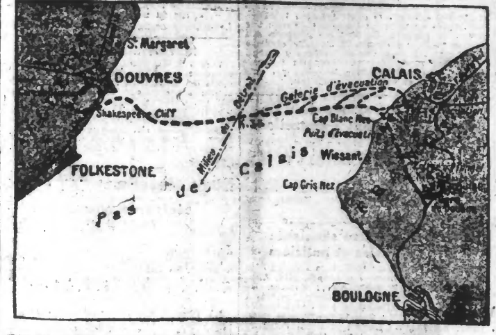
LE TRACÉ DU TUNNEL D'APRES LE PROJET FRANÇAIS

La Chambre des Communes va discuter aujourd'hui, à Londres, l'important problème que constitue la réalisation, depuis de longs mois envisagée et attendue, du Tunnel sous la Manche.