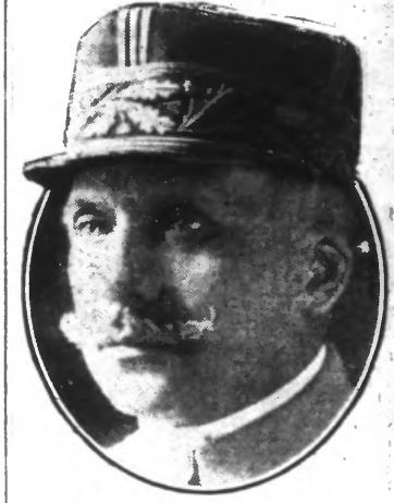
Le Général MAURIN, Inspecteur général de l'Artillerie et membre du Conseil supérieur de la guerre, le futur chef d'État-Major de l'Armée en remplacement du général Debeney.

Au cours d'un prochain Conseil des Ministres, M. Painlevé soumettra les mutations rendues nécessaires dans le haut commandement, par l'application des lois sur les limites d'âge.