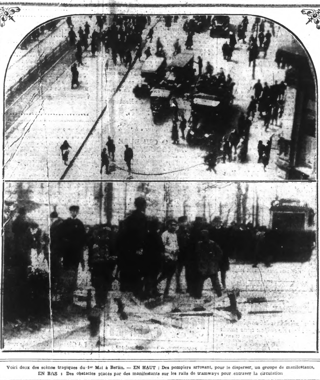
Voici deux des scènes tragiques du 1 er Mai à Berlin. — EN HAUT : Des pompiers arrosant, pour le disperser, un groupe de manifestants. — EN BAS : Des obstacles placés par des manifestants sur les rails de tramways pour entraver la circulation

9 morts, 300 blessés dont une centaine grièvement, 900 arrestations, tel a été le bilan des terribles bagarres entre communistes et policiers