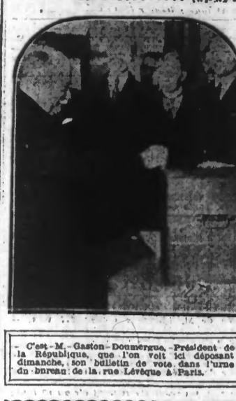
C'est M. Gaston Doormier, Président de la République, qui l'on voit ici déposant dimanche, son bulletin de vote dans l'urne du bureau de la rue Léveque à Paris.