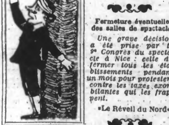
La Réveil du Nord.

Pour ne pas tant payer d'impôts, tous les directeurs de théâtre ont trouvé, pour défrayer leurs droits, un moyen qui n'est pas tout à fait licite.