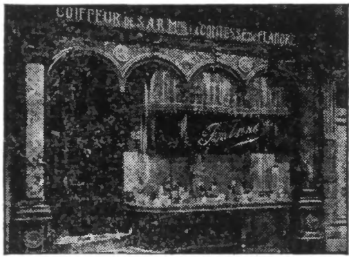
Voici l'institut de beauté de M. Fontaine, 25, rue Sainte-Gudule. M. Fontaine a eu le rare privilège d'obtenir des brevets de la Reine des Belges et de mériter la confiance des plus jolies femmes de l'aristocratie.

La base des soins de beauté "Le premier souci d'un expert de beauté, dit