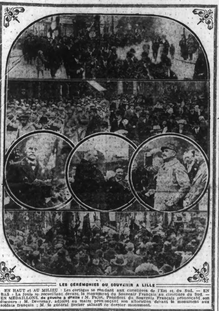
LES CÉRÉMONIES DU SOUVENIR A LILLE