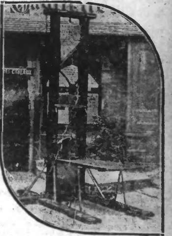
Cette guillotine qui date de la Révolution et qui est restée plus de 35 ans dans une cour de St-Julien-le-Pauvre à Paris, a été vendue 30.000 francs à un débauché des environs de Tours.