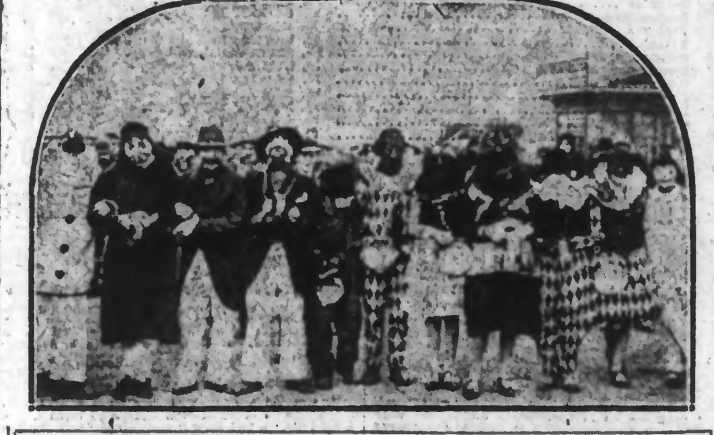
Un des rares groupes de masques aperçus hier à Lille.

Laissez de côté votre attitude, de Pierrot blanc, couleur de neige, Dimanche-Gras nous est apparu sous les aimables atours de sa majesté la fête printemps.