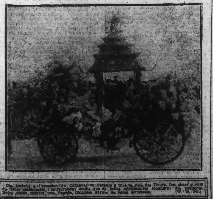
Ces jour-là à l'occasion du Carnaval de Nice, à la Fête des Fleurs. Des char de fleurs ornées d'embrasures, d'entretoises et de belles décorations de bouquets.