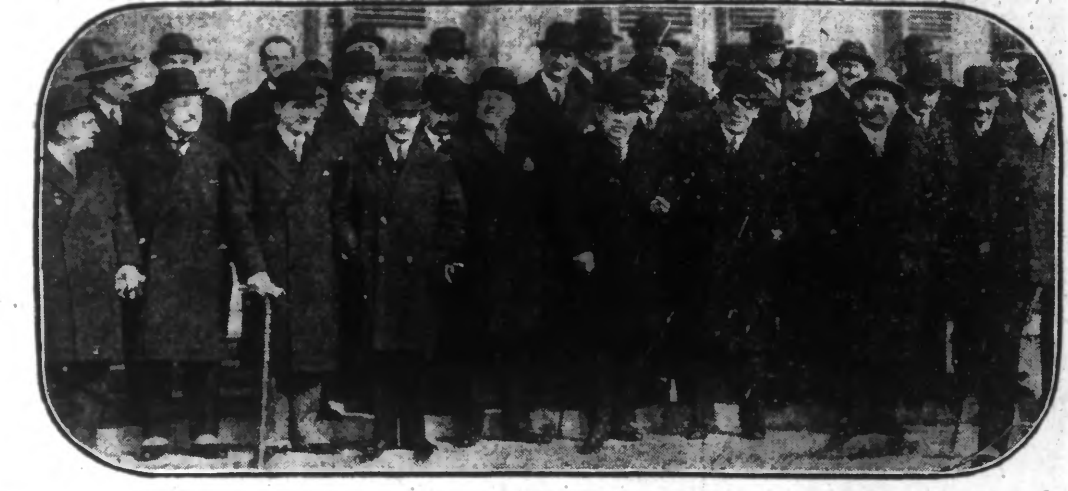
Les membres du second Cabinet Tardieu, photographés en groupe, sur les marches du rez-de-chaussée du Palais de l'Élysée.

La grosse journée reste à Hazebrouck fixée à la Mi-Carême qui groupe depuis toujours un cortège impressionnant sous la conduite