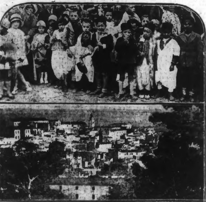
Le président de la République et sa suite ont repris la mer vendredi matin, à 7 heures, mais ce n'est pas pour rentrer en France. En effet, M. Doumergue a quitté Bône pour regagner Alger.