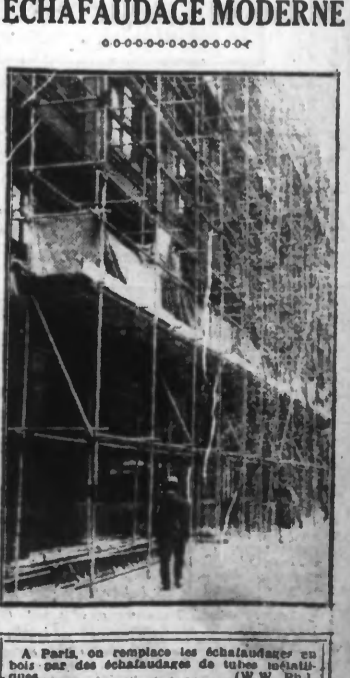
A Paris, on remplace les échafaudages en bois par des échafaudages de tubes métalliques.