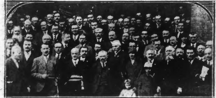
Les délégués au Congrès des Mutilés du Travail et à la Conférence des Avocats...

Il se doubla, vendredi, d'une importante conférence générale des avocats de France concernant la protection de ces accidentés.