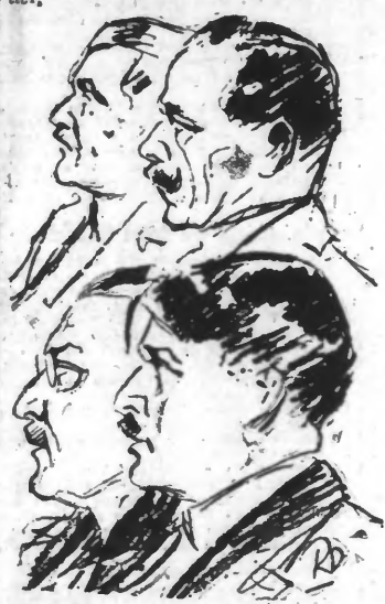
LES QUATRE INCULPES