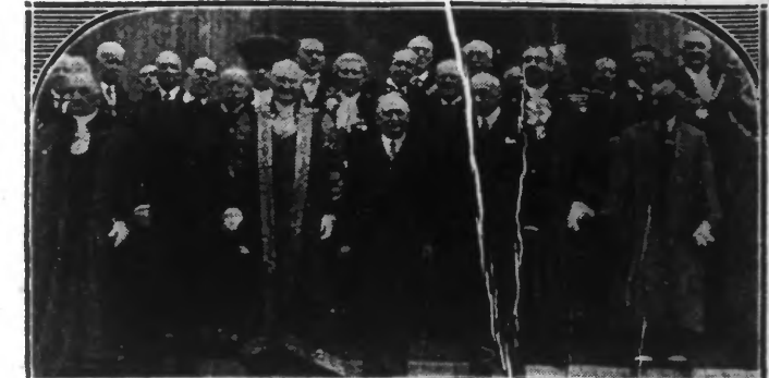
Les lords-maires entourant M. Doumergue, président de la République...