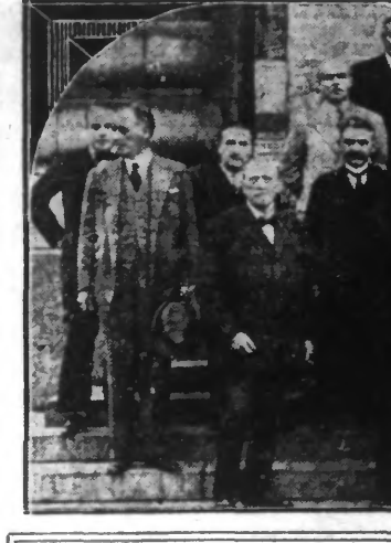
La réception de l'ambassadeur américain hier après-midi, à la Chambre de Commerce de Tourcoing...