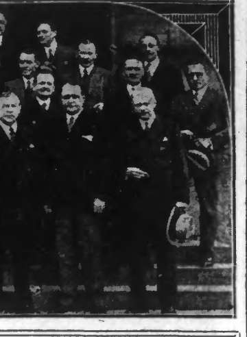
La réception de l'ambassadeur américain hier après-midi, à la Chambre de Commerce de Tourcoing...