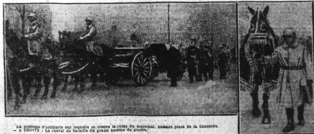
LA PROLONGE D'ARTILLERIE SUR LAQUELLE SE TROUVE LE CORPS DU MARÉCHAL, PASSANT PLACE DE LA CONCORDE. -- A DROITE: Le cheval de bataille du grand homme de guerre.

On voit arriver et prendre place successivement les ambassadeurs des nations étrangères... Cette douloureuse cérémonie.