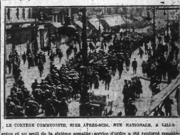
LE CORTÈGE COMMUNISTE, HIER, APRÈS-MIDI, RUE NATIONALE, À LILLE.

En raison de la réouverture des usines ce matin, le service d'ordre a été encore renforcé. Une manifestation communiste s'est déroulée dimanche à Lille sans incident.