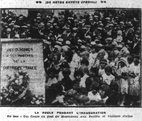
LA FOULE PENDANT L'INAUGURATION. En bas: Des fleurs au pied du Monument aux fusiliers et victimes civiles.

d'imposantes manifestations se sont déroulées hier à Requiognies, petite ville industrielle du bassin de la Sambre, à quelques kilomètres de la frontière belge. Le concours spontané de la population entière donna à ces cérémonies une impressionnante ampleur.