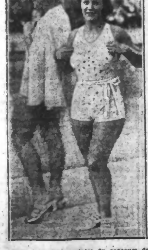
Voici deux des lauréates de concours de comédie de bain qui vient d'avoir lieu à Paris à l'occasion du Championnat de nation des artistes.

LAURÉATES Voici deux des lauréates de concours de comédie de bain qui vient d'avoir lieu à Paris à l'occasion du Championnat de nation des artistes.