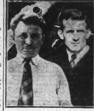
Les aviateurs POST ET GATTY

Nous avons annoncé hier, dans nos dernières éditions, que les aviateurs Post et Gatty s'étaient envolés du Havre de Grâce, pour leur raid transatlantique.