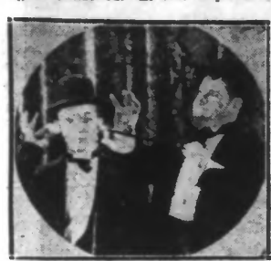
Les joyeux Laurel et Hardy

Feu mon oncle drame hilarant avec Laurel et Hardy