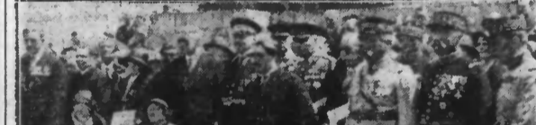
EN HAUT: Les autorités au cimetière de CAMBERS...

Aujourd'hui, à Montreuil-sur-Mer, un hommage solennel sera rendu au Maréchal Douglas Haig