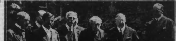
Notre photo prise dans les jardins du Ministère de l'Intérieur...