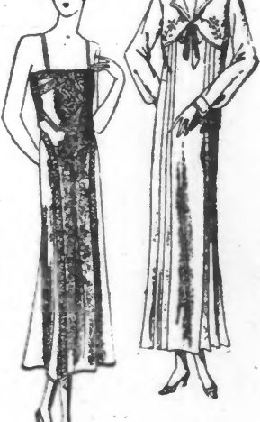
N° 1926 Mètre sur 2 m. 60 en 1 mètre. N° 1927 Mètre sur 2 m. 60 en 1 mètre.

NOS PATRONS PRIMES. A gauche. — Elegante combinaison-jupon de crêpe de Chine ou crêpe satin, garnie de dentelle bretonne.