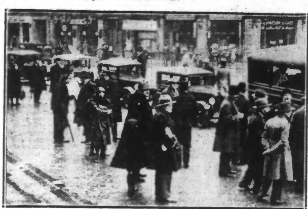
LE CORTÈGE DE PROPAGANDE PASSANT PLACE DU THÉÂTRE A LILLE

Afin de donner à la souscription nationale « La Dette » une large publicité, l'Union des Blessés de la Face organisait hier, à Lille, un grand défilé de propagande.