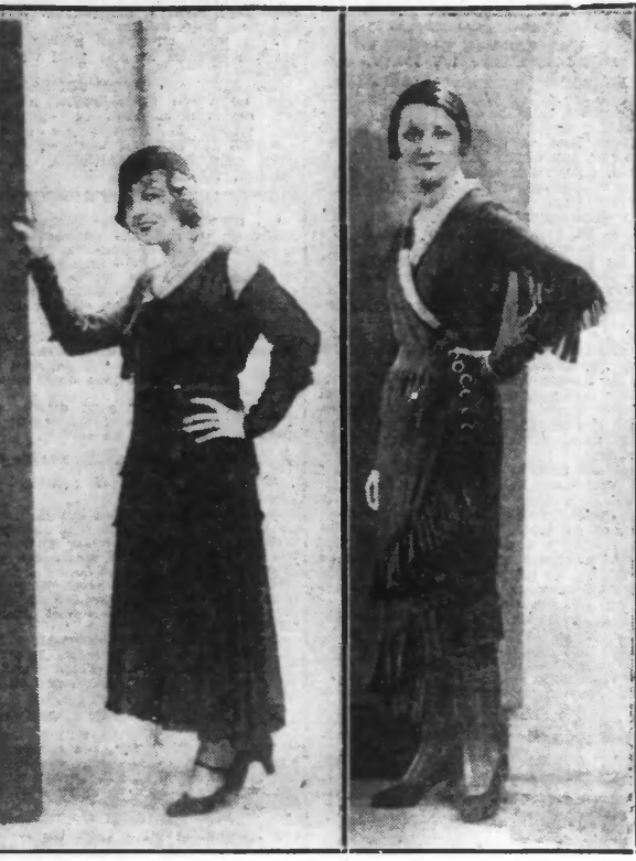
Robe d'après-midi en crêpe georgette noir, épaulettes dentelle crème. Robe crêpe georgette noir à volant, jupe boutonnée encolure blanche plissée.

NETTOYAGE DE FOURRURES DE CHEVRE DE MONGOLIE. Si vous avez à nettoyer les couvertures, d'entrebâches en fourrure de chèvre de Mongolie, lavez-les avec une éponge imbibée de mouton mou, moulu vinaigre. Les poils friseront avec plus de force qu'aparavant.