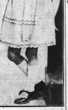
Robe d'enfant en crêpe bleu festonné.

Ceci n'est pas un conte de fées ; renseignez-vous.