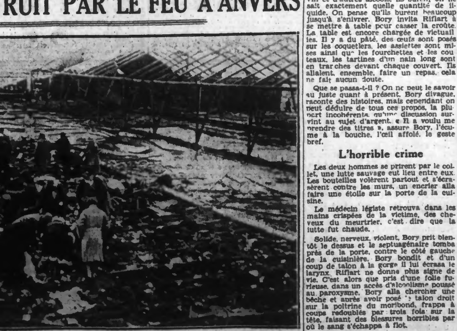
Nous avons annoncé qu'un cirque allemand qui était à ANVERS depuis quelques temps venait d'être complètement détruit par un incendie dont les dégâts s'élevaient à cinq millions de francs. Notre photo montre dans les décombres du cirque détruit, des curieux cherchant des souvenirs.