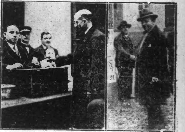
MM. Roger LANGERON, Préfet du Nord et Roger SALENGRO, Député-Maire de Lille. On voit à gauche: M. LANGERON déposant son bulletin dans l'urne au ter Bureau de Lille et à droite: M. SALENGRO arrivant au Bureau du Conservateur.