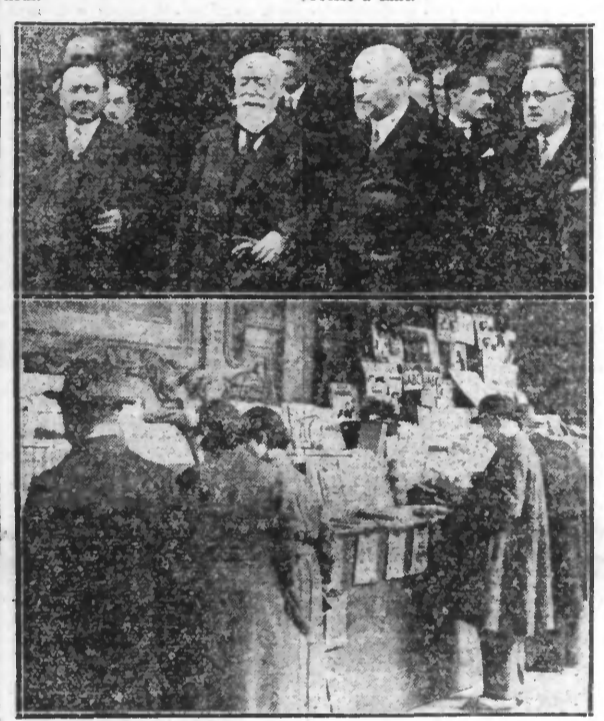
EN HAUT : M. Doumer, président de la République visitant l'exposition des livres dans les galeries des Portiques aux Champs-Élysées. — EN BAS : Un coin de l'exposition sous les galeries de la Vieille Bourse de Lille